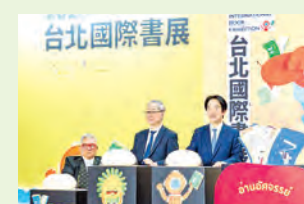
El presidente Lai Ching-te (derecha) y el ministro de Cultura Li Yuan (centro) inauguraron la 34.ª Feria Internacional del Libro de Taipéi el 3 de febrero en la capital.

Con 509 editoriales y organizaciones de 29 países, la feria consolida su posición como la mayor de