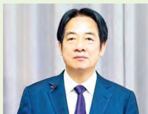
Lai Ching-te, Presidente de la República de China (Taiwán).

amplio abanico de temas tratados, desde comercio y asuntos militares hasta Taiwán y la guerra de Ucrania, la versión oficial de Pekín insistió en que Xi Jinping subrayó la cuestión taiwanesa como el principal punto de fricción bilateral, reite-