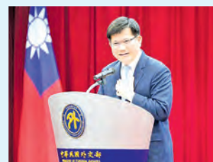
El ministro de Relaciones Exteriores, Lin Chia-lung, exhorta a los miembros del mundo libre a ampliar la cooperación con Taiwán en un artículo de opinión publicado el 4 de febrero en Foreign Affairs.

El valor de Taiwán como socio también es estratégico, señaló Lin, ya que se encuentra ubicado en una de las vías marítimas más importantes del mundo. El ministro añadió que el liderazgo de Taiwán