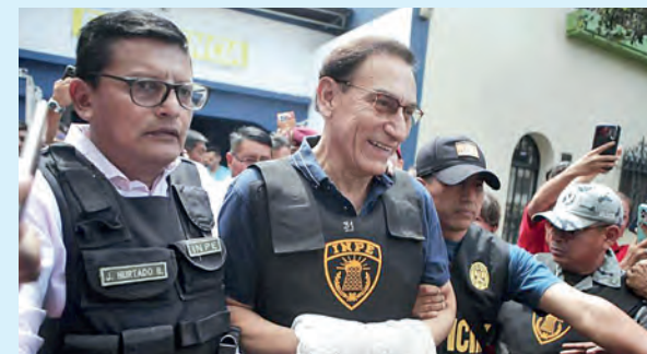
EL EXPRESIDENTE FUE DADO DE ALTA LUEGO DE PERMANECER HOSPITALIZADO POR UNA INTERVENCIÓN QUIRÚRGICA

Company Perú y Chavín Engineering & Construction S.A.C., por un monto superior a los 277 millones de soles. En respuesta, EMAPE negó cualquier irregularidad, sostuvo que el proceso se realizó con supervisión internacional y atribuyó las acusaciones a motivaciones políticas propias del contexto electoral.