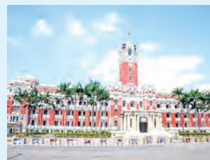
La Oficina Presidencial da a conocer la carta del presidente Lai Ching-te al papa León XIV en respuesta al mensaje del pontífice con motivo de la 59. a Jornada Mundial de la Paz.

A pesar de la presión militar de larga data por parte de regímenes autoritarios y de los intentos de socavar la soberanía de Taiwán mediante la tergiversación de la Resolución 2758 de la Asamblea General de la ONU, Taiwán ha mantenido su sistema democrático y su compromiso con la paz, afirmó Lai. El mandatario añadió que Taiwán está dispuesto a entablar un diálogo a través del Estrecho basado en la paridad y la dignidad, con la confianza mutua y el