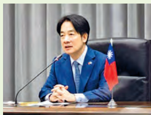
Lai Ching-te, presidente de la República de China

Lai destacó los sólidos resultados económicos del