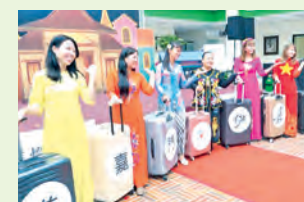
Inmigrantes estarán representados en el Festival de las Linternas 2026 en Chiayi