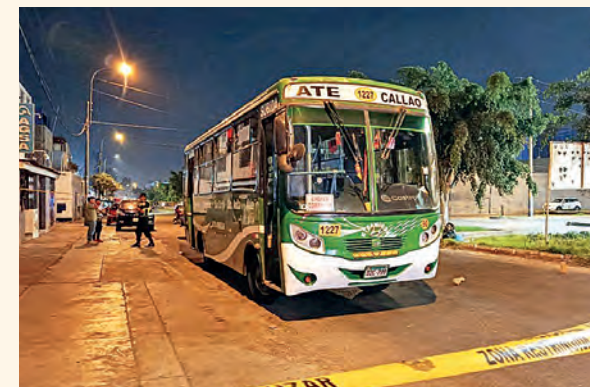
ruta CALLAO -ATE