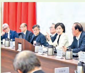
La vice primera ministra Cheng Li-chiun (quinta a la izquierda) toma la palabra en la 16.ª reunión del Comité de Política de Seguridad Nacional el 8 de enero en la ciudad de Taipéi.

Antes de la reunión, Cheng entregó premios a agencias e individuos que participaron en los ejercicios de resiliencia urbana 2025, organiza-