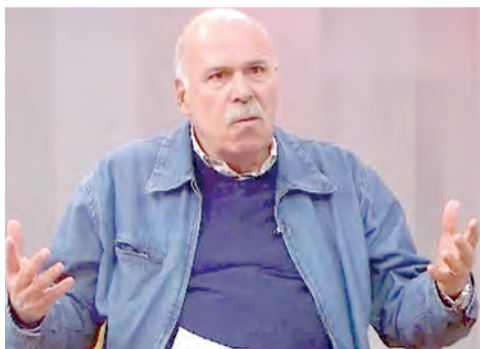
Alberto Jordán se la pinta claro a su institución frente a la inseguridad en los conciertos cumbiamberos.

Esta guerra (contra la criminalidad) no la vamos a perder", afirmó el presidente de la República, José Jerí, al anunciar que en los primeros días de enero se presentaría formalmente el nuevo Plan de Seguridad Ciudadana para enfrentar la delincuencia y la ola de extorsiones en el Perú. Sin embargo, la realidad se impuso con violencia: en el primer día de 2026, la criminalidad volvió a golpear la capital con un ataque a balazos contra un grupo musical en pleno concierto -que dejó dos personas heridas- y, horas antes de la llegada del Año Nuevo, el asesinato de tres personas