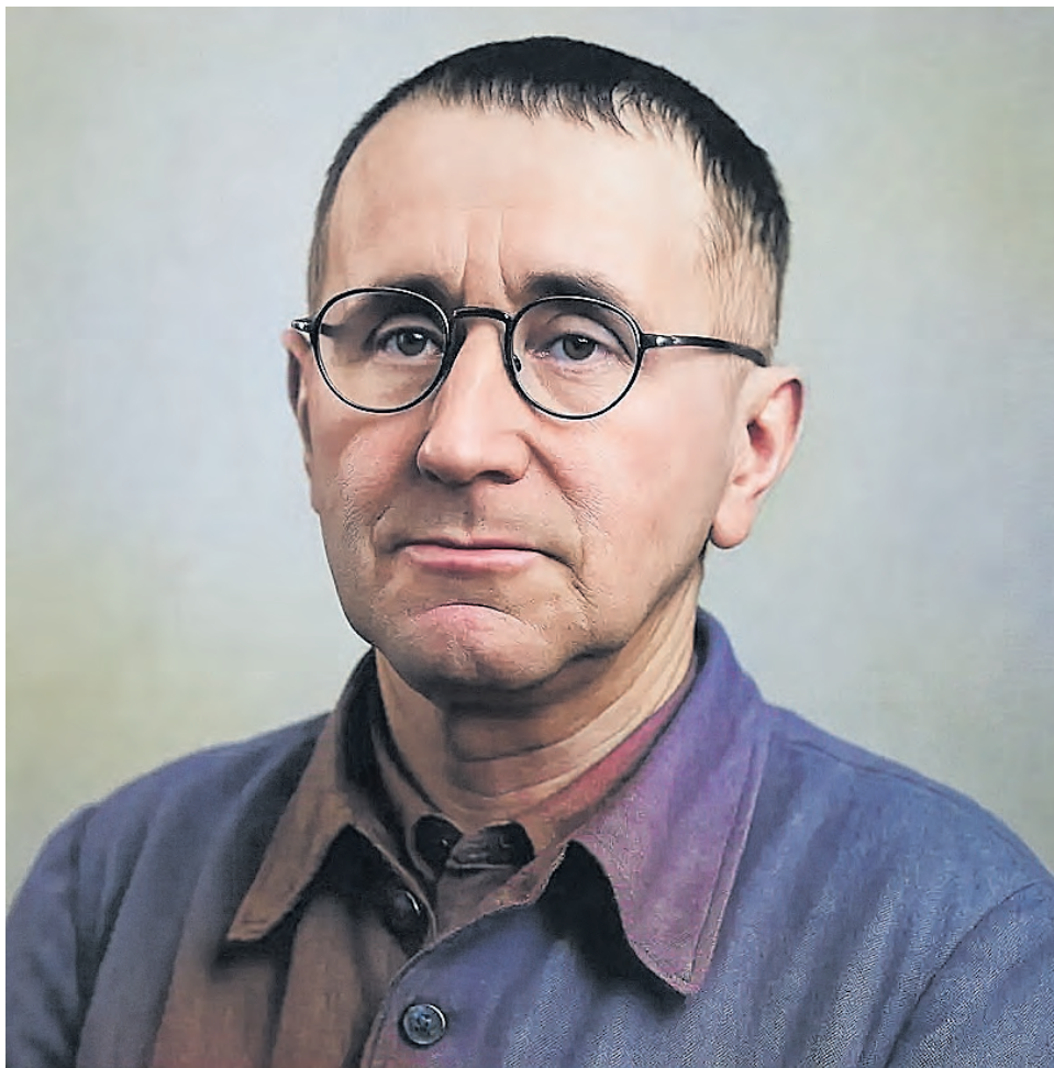
Bertolt Brecht, poeta que supo definir a un analfabeto político.

Sin embargo, el problema de fondo no está en lo complejo del acto de votación y menos en la ausencia de electores. El problema está en la gran cantidad de analfabetos políticos que votan sin criterio y sin un análisis mínimo. Son los más. El más peligroso analfabeto político,