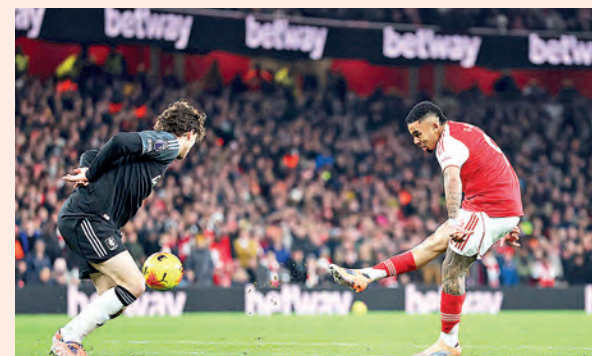
PREMIER LEAGUE: GOLEÓ AL ASTON VILLA