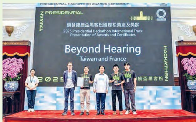
El presidente Lai Ching-te (centro) junto a Beyond Hearing, ganador de la categoría internacional de los Premios del Hackatón Presidencial 2025, el 14 de diciembre en Taipéi.

ganadores: ReSchool, AI-Powered Green Chemistry Diagnostic Advisor, Decarbon Strivers, Zha Nan y The Strivers. Bajo el tema Transformación Dual para el Crecimiento Verde, sus proyectos incluyeron: una plataforma integral para evaluación de riesgos químicos y soluciones alternativas más seguras; una plataforma de gestión sostenible para reciclar y reutilizar más de 120,000 toneladas métricas de posos de café al año; y un sistema