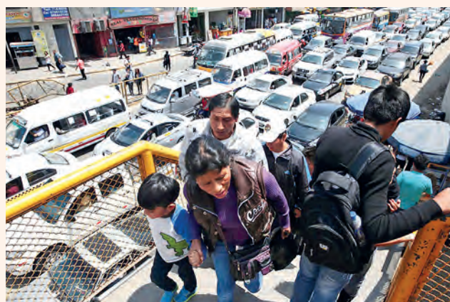
Nervios de punta, aguinaldo escuálido (cuando hay), tráfico del demonio. Esto y más es la Navidad para los limeños.

Quando el aguinaldo financia al choro y el Espíritu Santo cede ante el estrés del tráfico infernal.