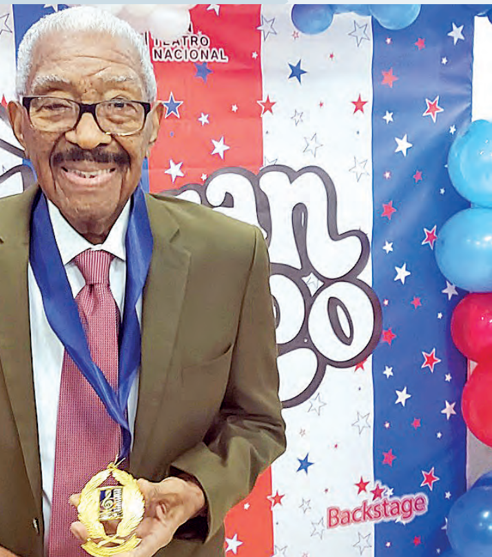
El legendario pianista y director musical de EGC falleció el último 6 de diciembre en a los 99 años.

CIONES QUE HACÍAN FELICES A LOS BAILADORES CON LETRAS TABAN HISTORIAS SOBRE SER PUERTORRIQUEÑOS. LO OS; NUNCA HABRÁ OTRO RAFAEL ITHIER”, DIJO COLÓN.