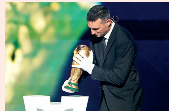
LO SEÑALÓ LIONEL SCALONI TÉCNICO DE ARGENTINA

conocerán las fechas y horarios de todos los partidos y así quedar el fixture completo para la nueva Copa del Mundo 2026, a realizarse en los tres países, Estados Unidos, México y Canadá.