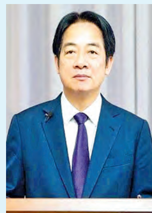
Presidente Lai Ching-te

El director del Instituto Americano en Taiwán, Raymond Greene, también elogió la decisión, señalando que sitúa a Taiwán al nivel de otros socios democráticos que están aumentando sus inversiones militares. Greene recordó que la obtención rápida de