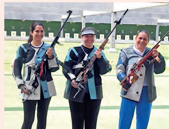
XX JUEGOS BOLIVARIANOS AYACUCHO-LIMA 2025

FLAMENGO Y PALMEIRAS AMBOS BRASILEÑOS DISPUTAN ESTA TARDE EL TÍTULO DE LA COPA LIBERTADORES EN EL MONUMENTAL.