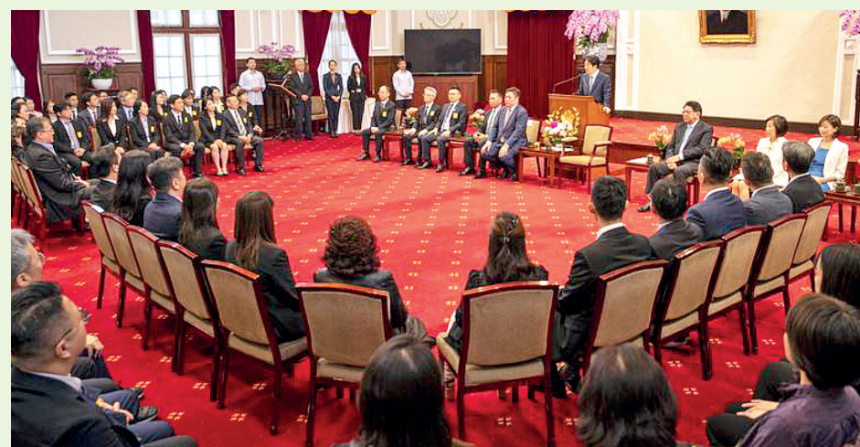
Lai Ching-te se dirige a exalumnos de la Universidad de Tecnología de Taipéi en la Oficina Presidencial

Lai subrayó que el crecimiento de la economía taiwanesa se refleja en fenómenos como el auge de la bolsa de valores y la llamada “economía de conciertos”, lo cual ha generado ingresos fiscales sólidos. Estos recursos se destinan al desarrollo económico y social, incluyendo apoyos a las PYMES, incentivos para la industria tecnológica, defensa nacional y programas sociales