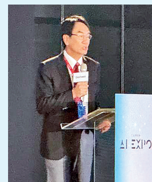
Lin Yi-jing, viceministro de Desarrollo Digital, en la inauguración de la AI EXPO Taiwan 2025

Según Kuo, se estima que el mercado global de la IA generativa alcanzó los 40 000 millones de dólares en 2024 y crecerá hasta 1,5 billones de dólares en 2030. El ministro destacó que la IA ya está transformando sectores como la manufactura, la medicina, el comercio, las finanzas y el transporte. Para facilitar la inte-