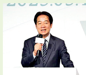
El presidente Lai Ching-te en la ceremonia de apertura del Foro Yushan.

les y resaltó el apoyo a la estabilidad y la paz en Taiwán, así como a un Indo-Pacífico libre y abierto. Subrayó que el Foro Yushan ha reunido a más de 3600 participantes de 28 países en los últimos ocho años, consolidando la conexión entre Taiwán y el mundo. En este período, la política de la Nueva Política hacia el Sur ha logrado avances significativos en áreas como la cooperación