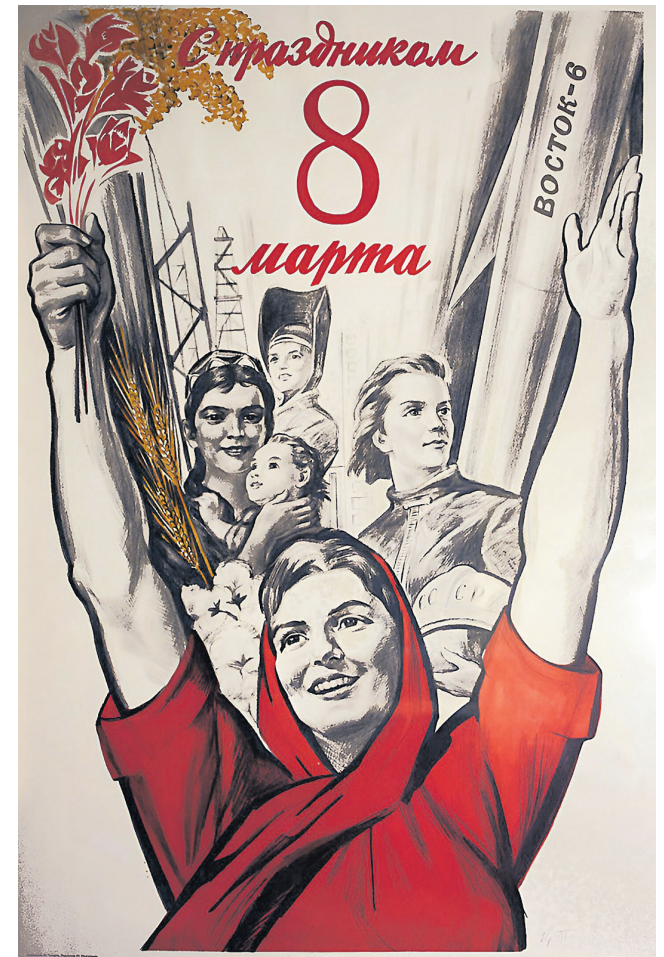
Traducción: “Feliz día del 8 de marzo”. Cartel soviético de 1964. Autor: Iraklii Moiseevich Toidze

La modernidad, culturalmente hablando, cambió el sentido de la jerarquía, que ordenaba a las sociedades antiguas, por el de la igualdad ante la ley. En principio, la igualdad no es un referente de hecho, sino un imperativo de orden moral, el λόγος [logos], la palabra, como lo contrario al silencio, permite hasta cierto punto establecer relaciones de igualdad en el espacio público, pero para esto tienen que surgir condiciones materiales que la hagan posible. Hasta el siglo XVIII, el liberalismo animó todo espíritu encendidamente revolucionario contra las relaciones sociales del modo de producción feudal. Una vez que el burgués tomó el control del poder del Estado, dejó de animar todo cambio en el mundo real, para aleccionar moralmente desde el mundo de las ideas, lo que no fue capaz de realizar. En ese nuevo orden, la libertad económica no permitía ampliar más las libertades políticas. En ese reino de la libertad, el proletariado lo tuvo todo muy difícil, y la mujer obrera, todo en contra.