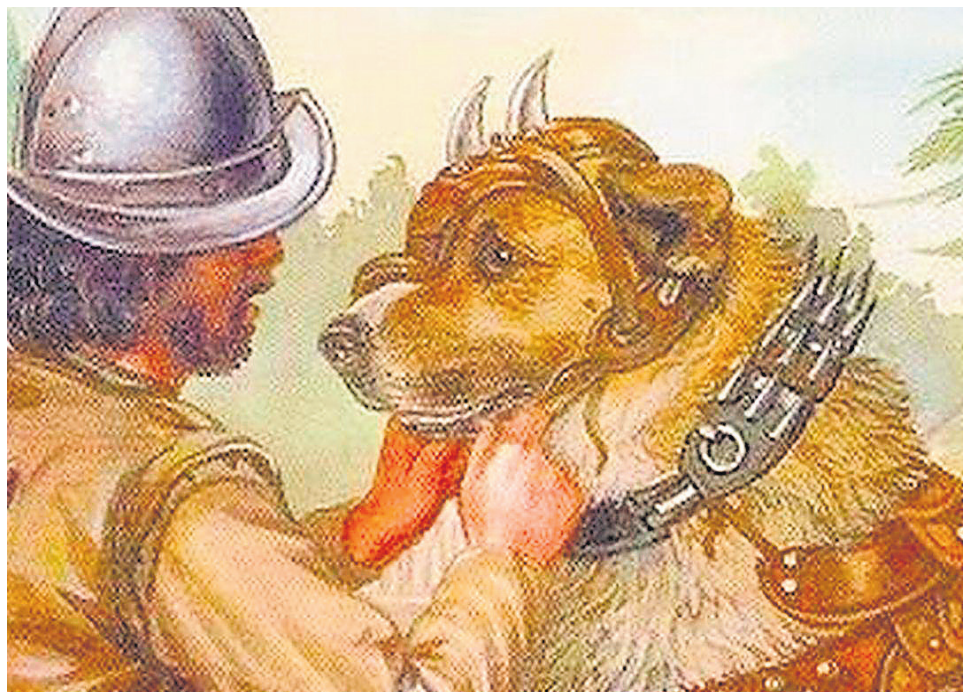
Los escribas oficiales españoles niegan hasta a los perros de la invasión hispana al Perú.

ces, la religión cristiana y la cultura española.